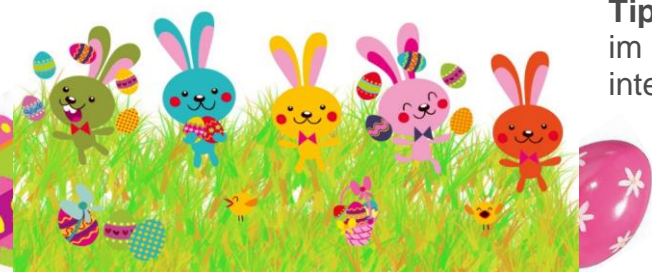
FINGERSPIEL – Verwandle deine Finger in Osterhasen